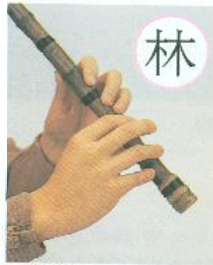
①, ②, ③공 짚음(④공 땀)