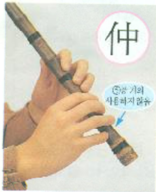
①, ②, ③, ④공 짚음