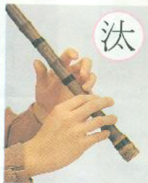
모두 다 땀