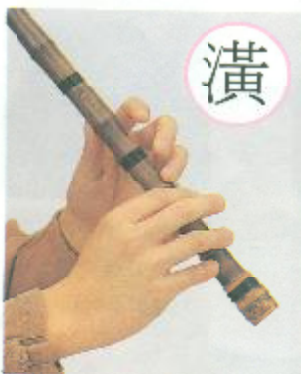
①공 짚음(②, ③, ④공 땀)