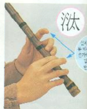
①, ③공 짚음(②, ④공 땀)

Корейская народная музыка разнообразна и сложна, но во всех её видах используется один и тот же набор ритмических рисунков, называемых чандан (장단), а также характерные ладовые звукоряды. Музыка украшена мелизмами и форшлагами. Каждый из видов мелизмов, форшлагов на дансо имеет свои установленные знаки для исполнения.