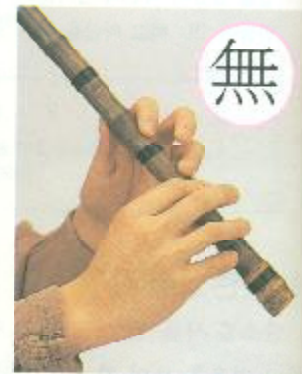
①, ②공 짚음(③, ④공 땀)