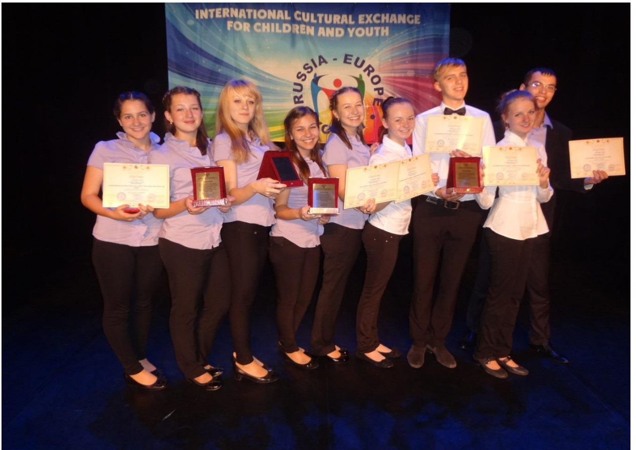
Лауреаты I Международного музыкального конкурса «Россия-Европа молодая», 2013