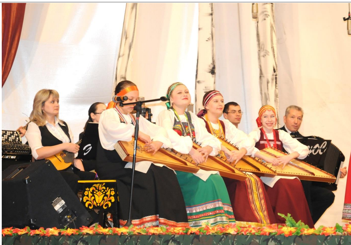
Городской конкурсе «Красная горка», 2013г.