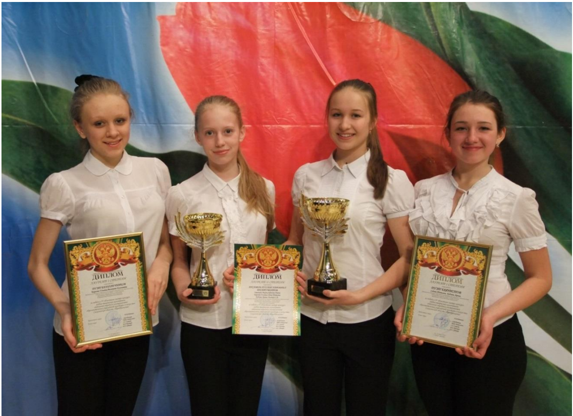
Лауреаты IV областного смотра-конкурса творческих коллективов «Преображение», 2013