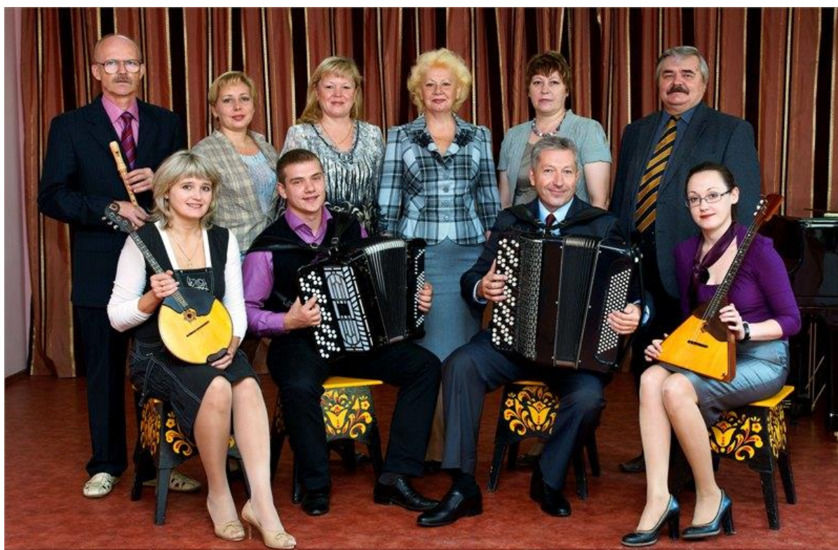
Состав методического объединения «Русские народные инструменты», 2013г.

В данной Концепции сказано, что формирование современной системы сопровождения непрерывного профессионального развития педагогических кадров сферы дополнительного образования детей является одним из направлений дальнейшего развития дополнительного образования.