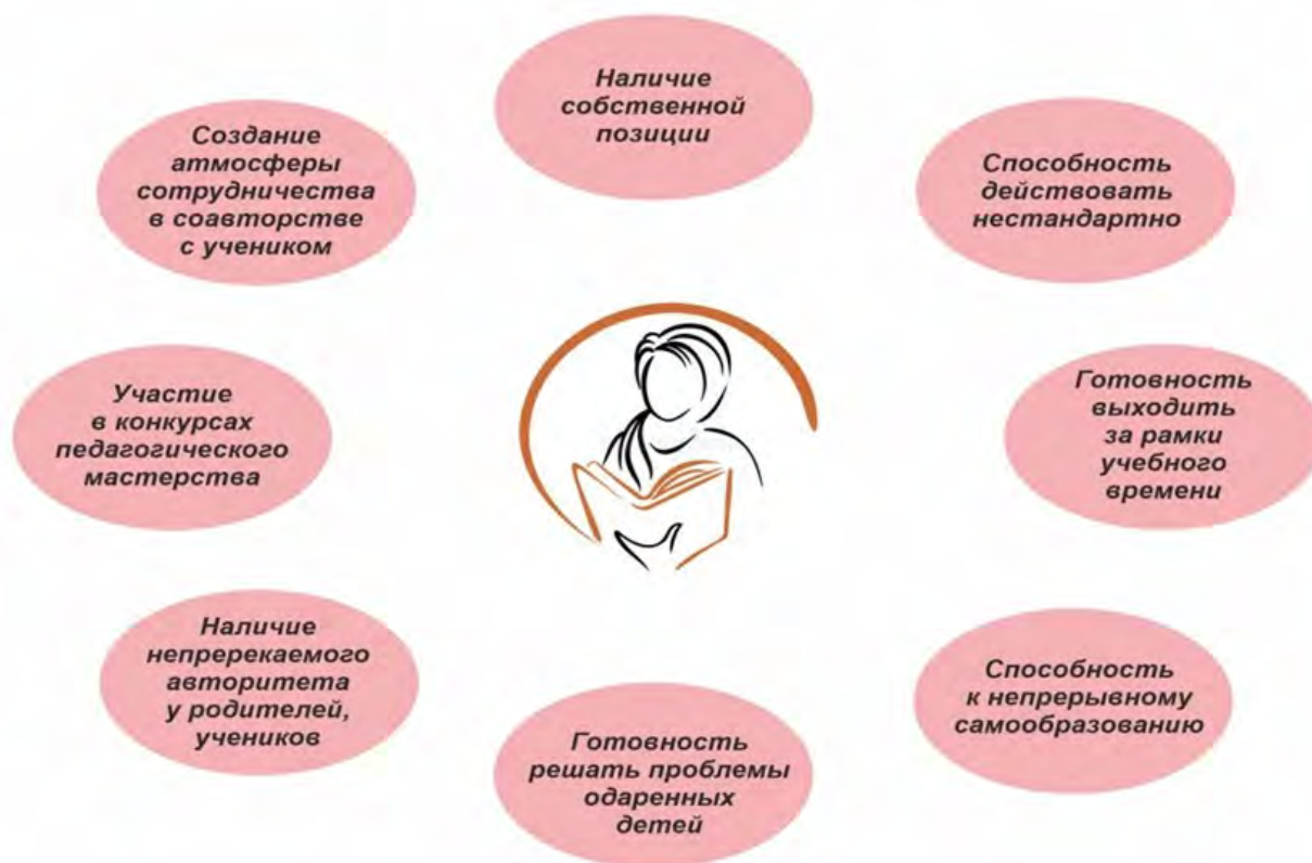
модель № 6