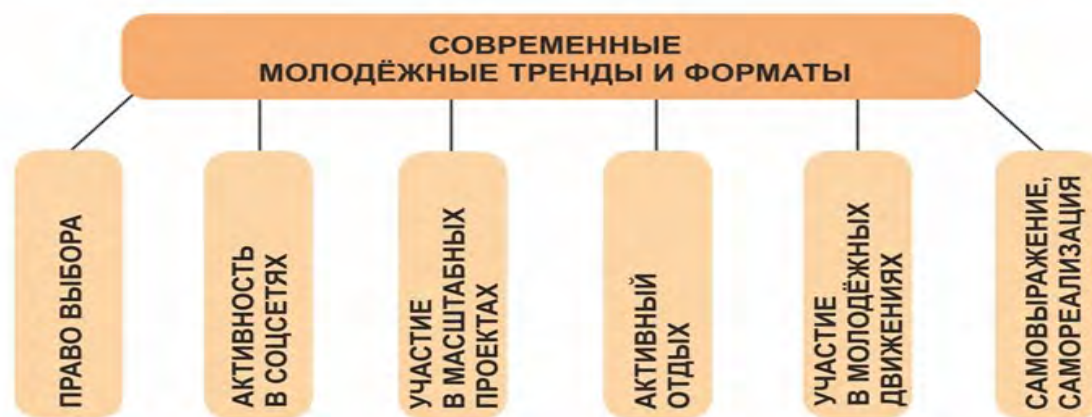
модель № 3

обоснованно можно говорить о том, что система работы по выявлению, развитию и поддержке одаренных детей действенна, эффективна и результативна. Находясь в рамках этой системы, мы наработали определенную практику, основанную на встраивании ребенка в сложившуюся и опробованную в течение многих лет модель.