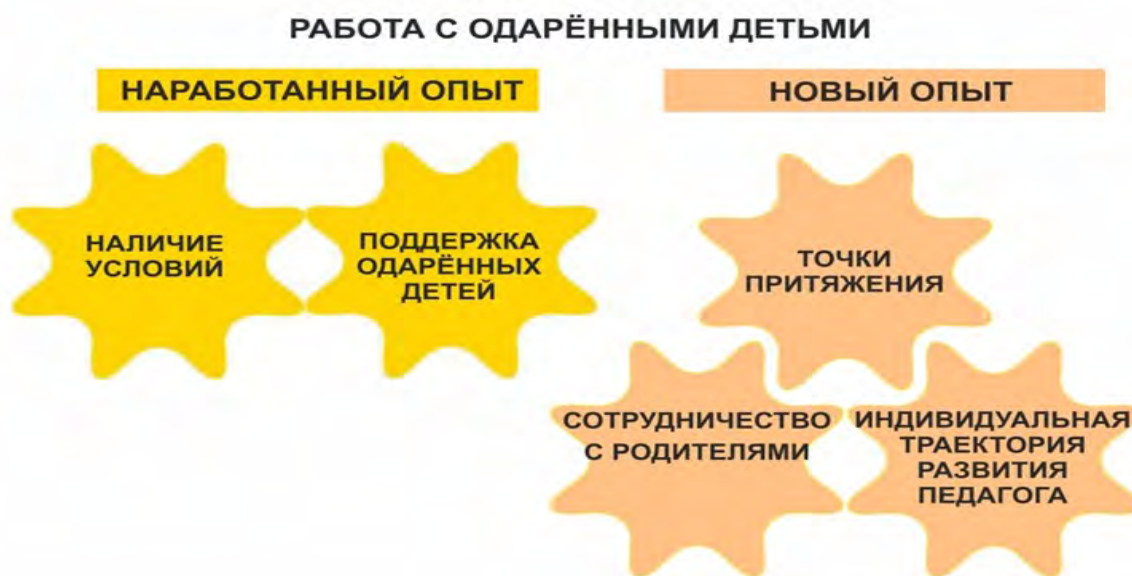
модель № 4

Что такое « точки притяжения »? Это такие образовательные и творческие пространства в разных регионах, в том числе и в Сахалинской области, наполненные разнообразным функционалом, место общения и творческой активности. Как правило, это топ таких мест, где наши учащиеся занимаются масштабной, значимой и увлекательной для них творческой или иной деятельностью. Мы ищем эти точки притяжения, используя внешний ресурс, или организуем их сами. К таким точкам притяжения относятся: