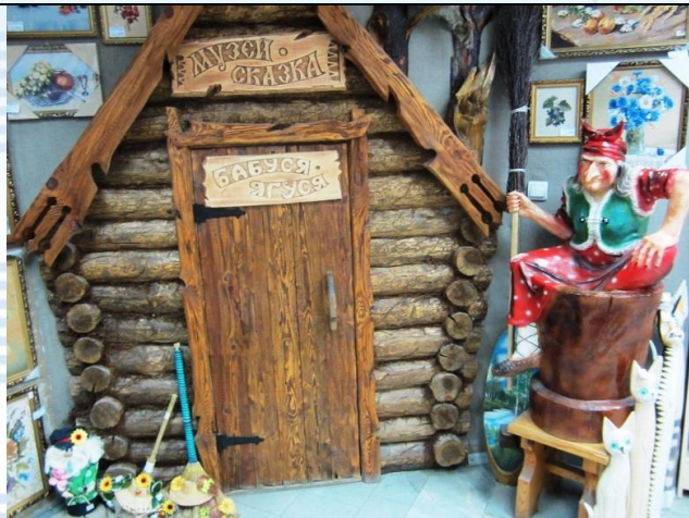
Музей-сказка «Бабуся-Ягуся» г.Владимир.