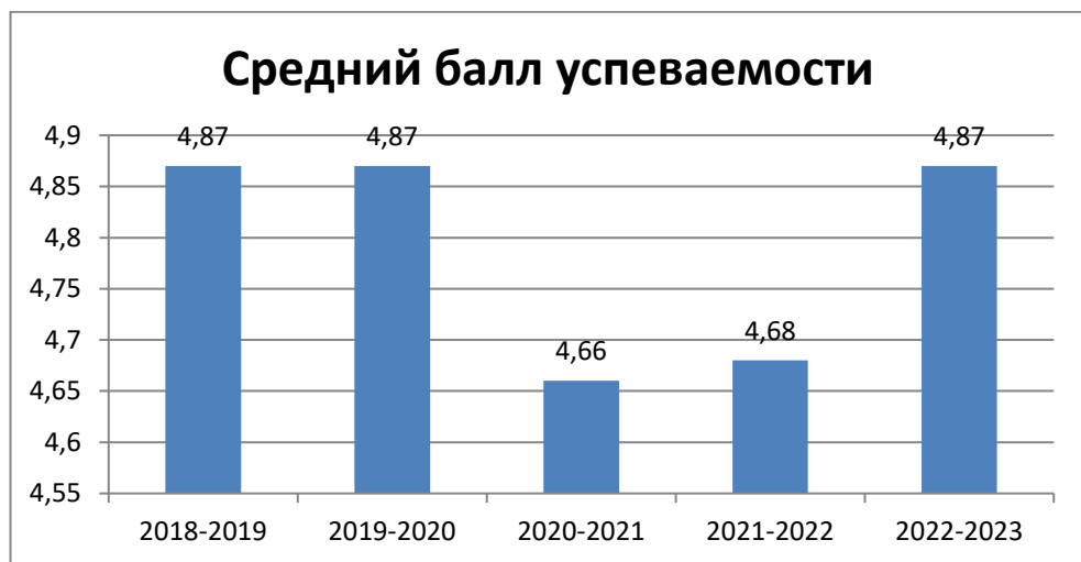
Диаграмма % успеваемости и % качества ( средний балл)