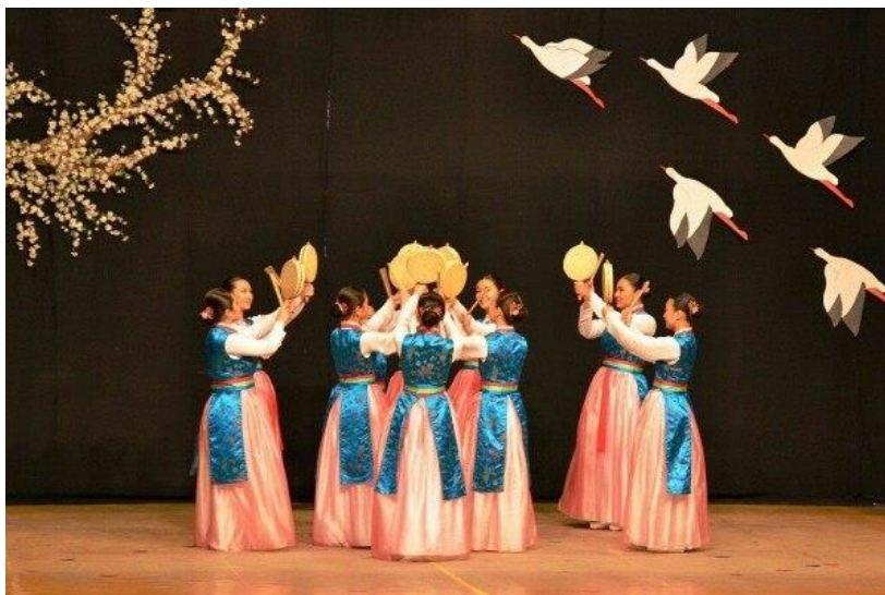
Корейский национальный танец «Согочум»

стороне инструмента. Используется в танце «Согочум». Танец демонстрирует разнообразные высокотехнические движения, которые включают в себя вращения, бой на обеих сторонах сого, прыжки и приседания. Танец исполняется под различные ритмы (чанданы) включая Куткори, Чаджинмори, Донсальпхури, Хвимори. При каждом изменении ритма происходит изменение движений. Танец подарен во время стажировки в государственном центре традиционной музыки провинции Чолла-намдо.