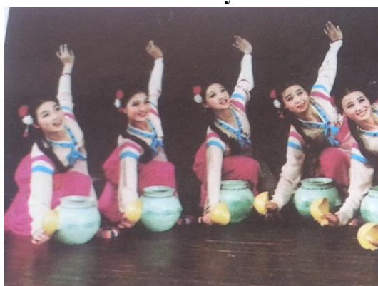
Танцевальный атрибут Мультион, используется в «Танце с кувшинами»

Корейский танец с мечами является одной из самых хранимых и почитаемых корейских традиций народного танца. Истоки танца кроются в исторической войнах Кореи. Первоначально исполнялся при дворе королевской семьи. Согласно древнему преданию, мальчик по имени Хван Чан обладал настолько невероятным мастерством танца с мечом, что царь враждебного государства пригласил его выступить при дворе. Мальчик выступил для царя, после чего убил его и покончил с собой. Родное царство мальчика почтило