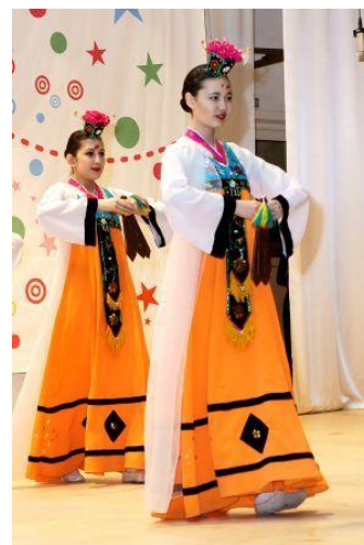
Корейский национальный танец «Абак»

Выстукивающий корейский народный инструмент Абак (относится к разряду хлопушек-кастаньет и по форме напоминает сложенный веер). В абак хлопают во время исполнения движений танца. Используется в придворной и ритуальной музыке. Абак состоит из трёх деревянных пластин, которые свободно соединены в верхней части при помощи кожаного шнурка. Используется в танце «Абакчум». Помимо Абак в танце используется маховый танцевальный атрибут-шелковый шарф.