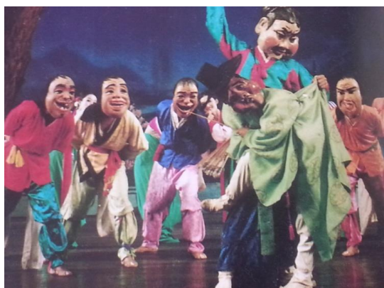
«Танец в масках»

Маски являются религиозными реликвиями, обладают магической силой и защищают от злых духов. Танцы в масках представляют собой театральное представление, объединяющее в себе остроумный рассказ, с юмором и иронией показывающий жизнь разных слоев общества: дворян, духовенства, простых людей в пении и танце. Танец представляется в виде игры, в него вовлекаются и зрители. Изначально танец с масками получил развитие как обряд изгнания злых духов в обряде жертвоприношения, связанного с шаманизмом. Танец в масках исполняется в разнообразных формах в зависимости от содержания и